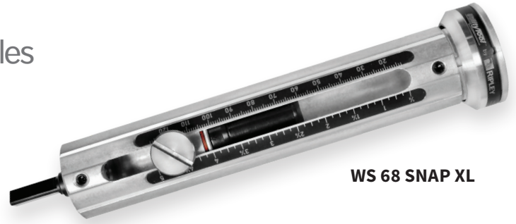
WS 68 SNAP XL