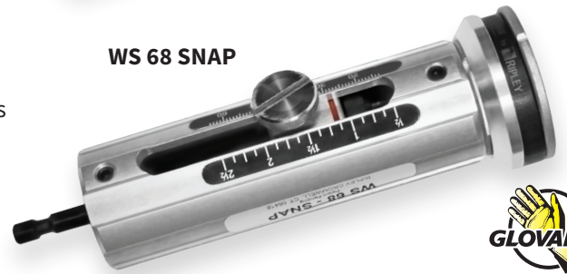
WS 68 SNAP